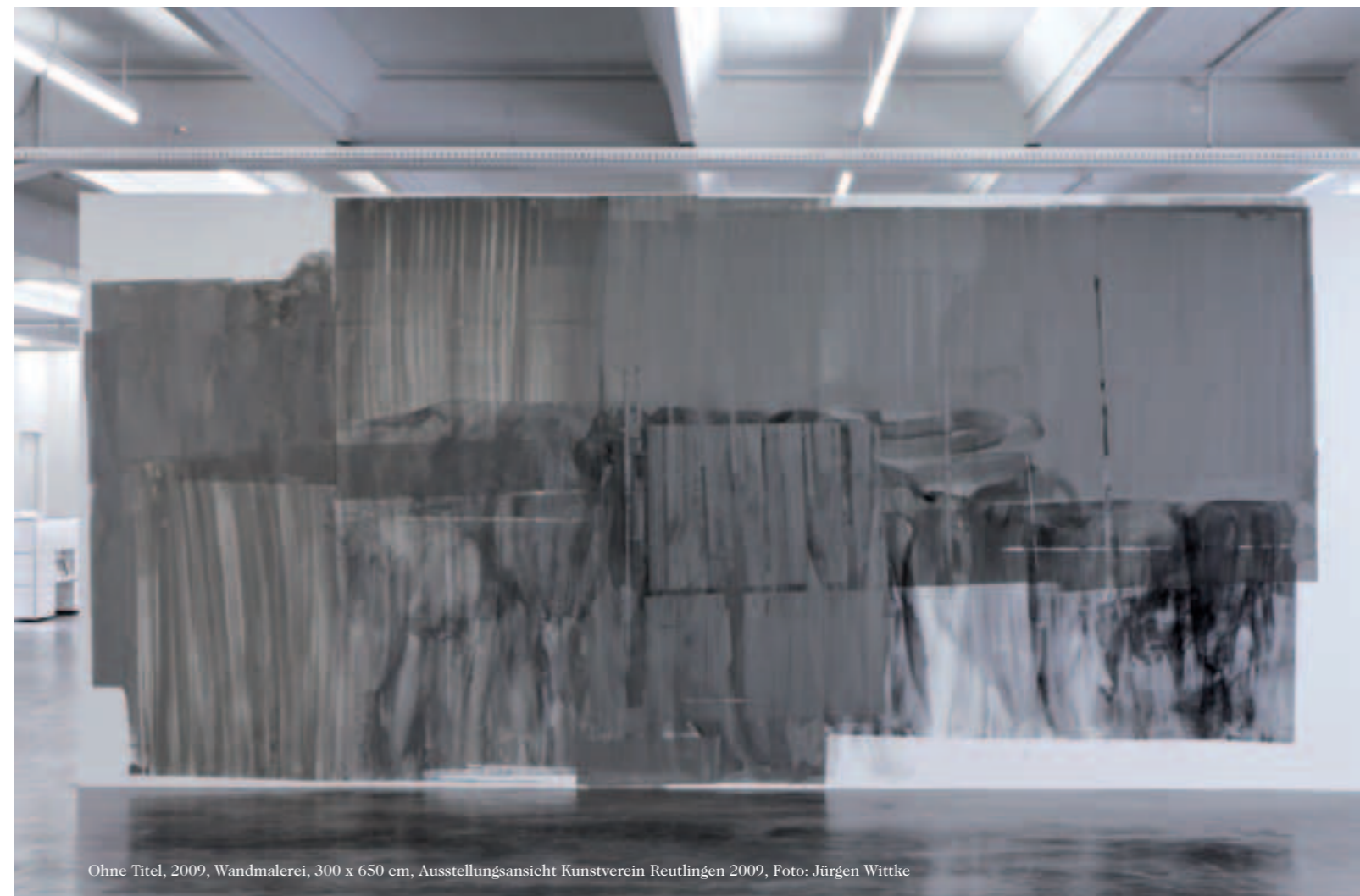
Ohne Titel, 2009, Wandmalerei, 300 x 650 cm, Ausstellungsansicht Kunstverein Reutlingen 2009, Foto: Jürgen Wittke